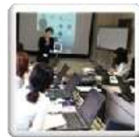
市のパソコン講座にて

※無料体験ではおさいふは持ってこないでください。吟味して頂き入校をお決めになった時でけっこうです。